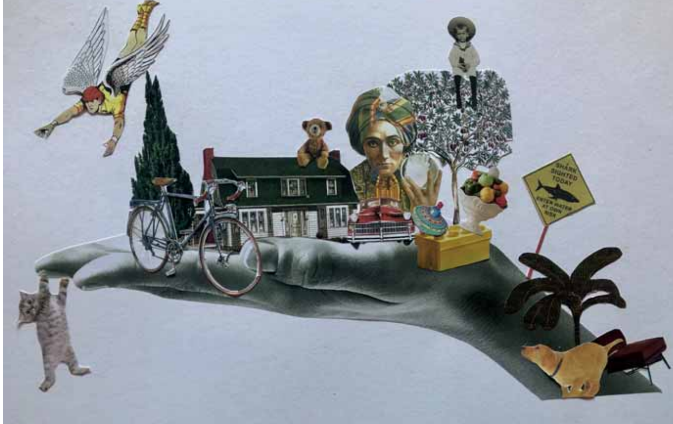
Projectbeeld van The Voice of Kids, collagetechniek door Mieke Vanbergen.

ding anders naar de liefde en het huwelijk dan voorheen, maar vinden dat niet altijd erg. Hun verwachtingen zijn door de tijd heen veranderd. De kinderen waarmee we hebben gesproken, geloven misschien wel minder in die éne liefde, ze geven ook aan op een bepaalde manier sterker te zijn door de worstelingen. Daardoor voelen ze zich wel meer gewapend voor toekomstige uitdagingen.